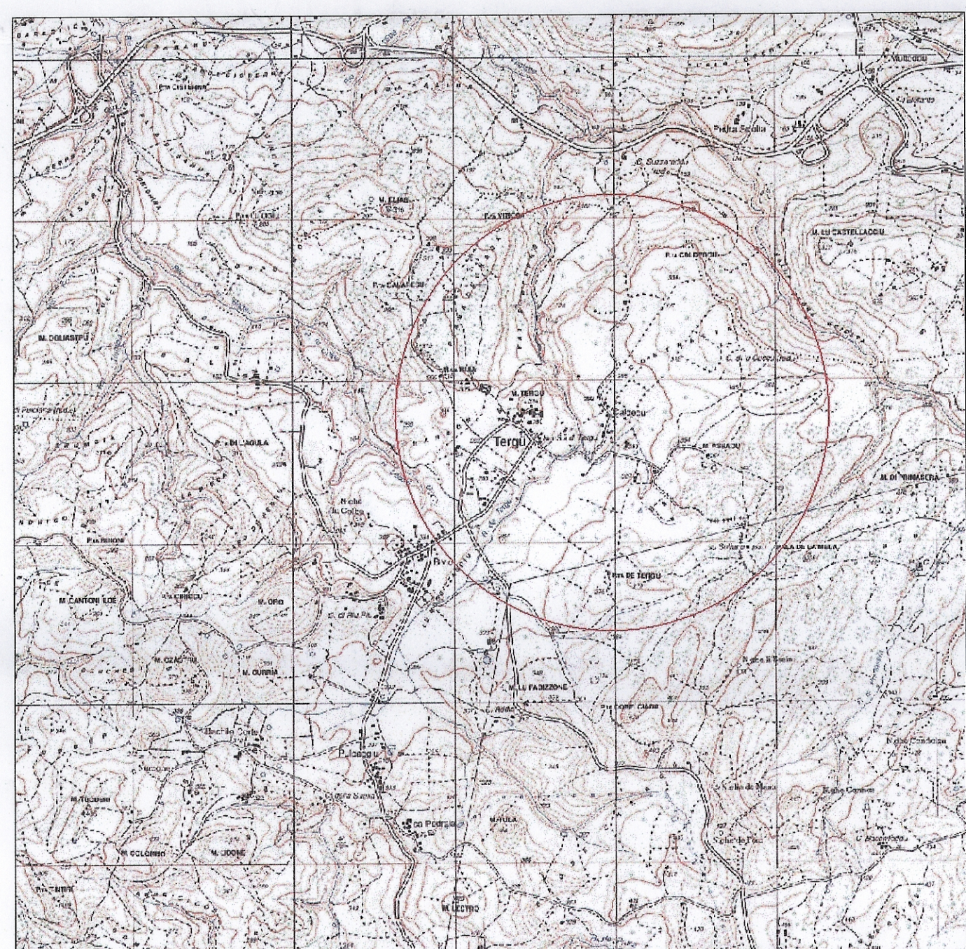
Starico IGM 25:000 - Foglio 442090 - Tergu